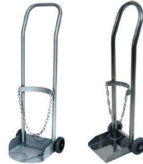
산소병 운반카 (20kg) OXYGEN TANK CART IC-723 STEEL (철재) IC-727 STAINLESS STEEL (스테인리스 스틸)