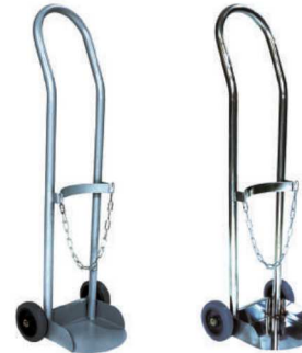
산소병 운반카 (10kg) OXYGEN TANK CART IC-724 STAINLESS STEEL (스테인리스 스틸) IC-725 STEEL (철재)