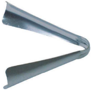
핑거스프린트 FINGER SPRINT IC-160