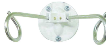
벽부착형 링겔훅 TWO HOOK IC-717