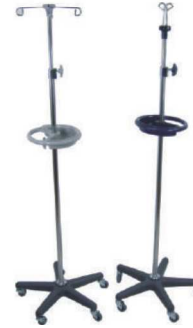
링거폴대 I.V POLE STAND (5caster & Basket) IC-715