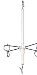
천장형 링겔훅 I.V BOTTLE HOLDER IC-716