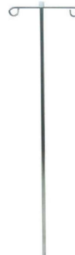
링거걸이 침대용 I.V HANGER EC-002