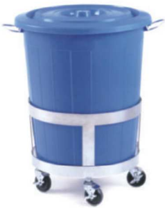
이동식휴지통 DUST BOX CART EC-004 Ø 500 × 800mm