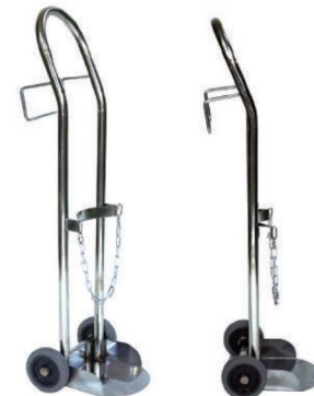
산소병 운반카 (고리부착형) OXYGEN TANK CART IC-728