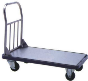
화물운반카트 TRUCK CART EC-005 900 × 600 × 850