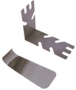
튜브 스탠드 TUBE STAND 암 프로텍터 ARM PROTECTOR IC-211 IC-212