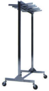
X-RAY 용 납옷걸이 X-RAY GOWN HANGER IC-763