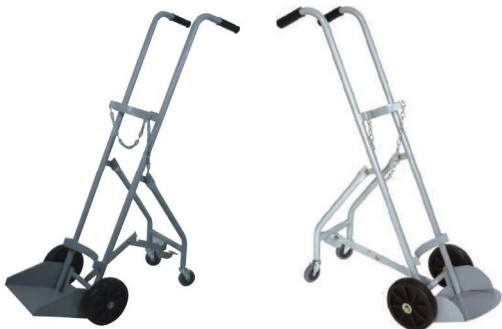
산소병 운반카 (40kg) OXYGEN TANK CART IC-721 STAINLESS STEEL (스테인리스 스틸) IC-722 STEEL (철재)