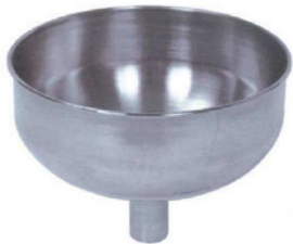
깔대기 FUNNEL IC-220