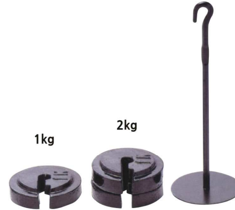
추걸이 & 추 WEIGHT & HANGER EC-001-1