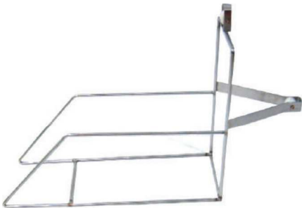
브라운 스프린트 BROWN SPRINT EC-001